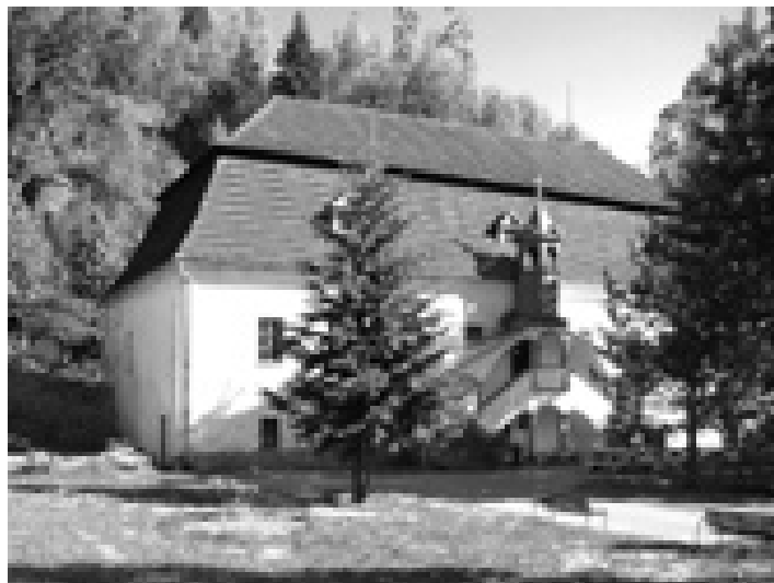
19. – 27.8. Ken Mai – Expresse/Impresse, divadelní a taneční dílna japonského butó tanečníka, zámek Skály – Bischofstein, Teplice nad Metují, Broumovsko

Účastnický poplatek: 3600 Kč včetně ubytování se snídaní. Příjezd účastníků 28. 7. večer, dřívější příjezd pro zájemce o účast na festivalu Týden pro Broumovsko je po dohodě možný.