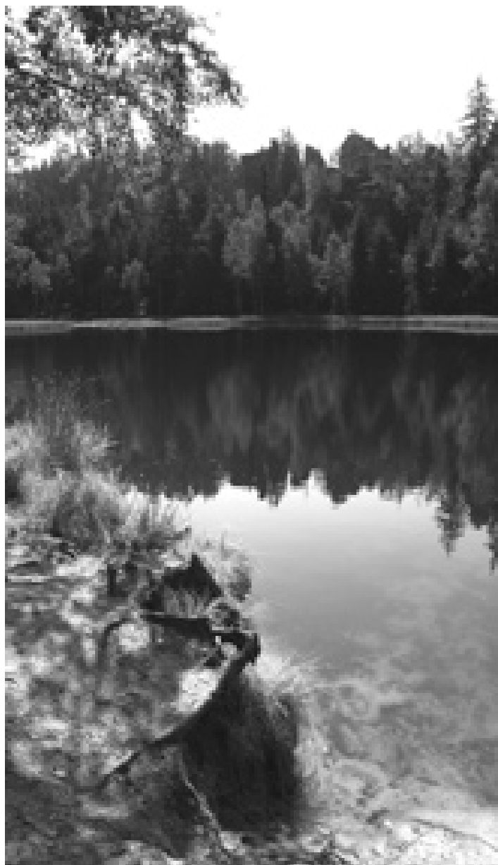
Kulturní akce v Teplicích nad Metují červenec a srpen 2005

Pro sociálně slabé zájemce o umělecké dílny je po dohodě možno poskytnout stipendium pro kompenzaci části nákladů na dílnu, podmínkou poskytnutí stipendia je napsání žádosti formou motivačního dopisu předkonáním dílny, včasné zaplacení zálohů účastnický poplatek, absolvování dílny v celém rozsahu a doporučení k udělení stipendia vedoucím dílny. Stipendium, pokud bude uděleno, bude vyplaceno pouze po skončení dílny. Absolvováním dílny a splněním všech podmínek nevzniká právní nárok na udělení stipendia.